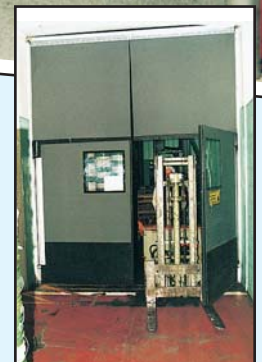
Puerta Poly-Kor™ con Sobre-paño Flexible